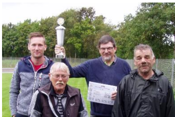
Spillere fra KFUM med pokalen vundet i 2017

fællesskab med den forening hvor stævnet afholdes, og udsendes til medlemsforeninger samarbejdspartnere og andre relevante personer og klubber 3 uger før stævnet.